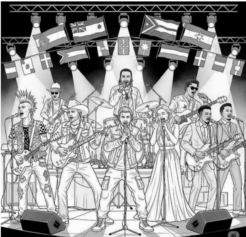
Figura 6 Ilustración de orquesta en concierto