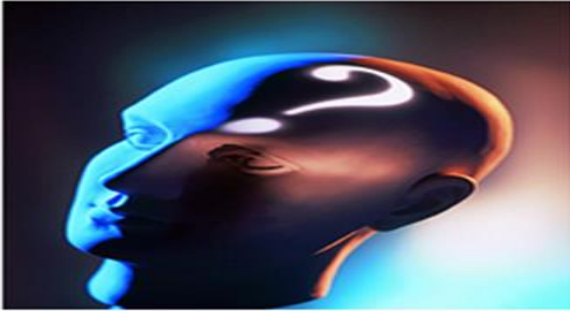
Falta de conocimiento