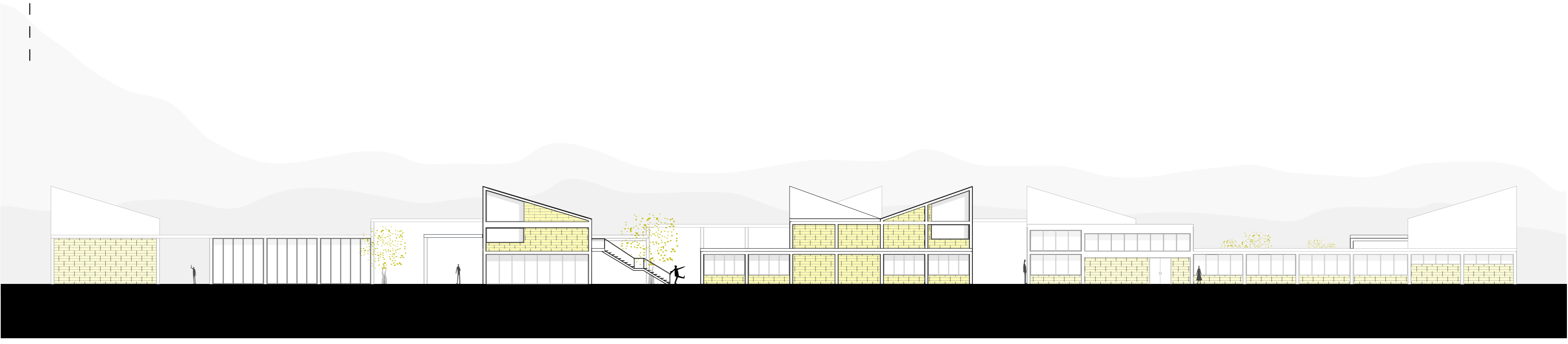
FACHADA LATERAL IZQUIERDA ESCALA 1:250