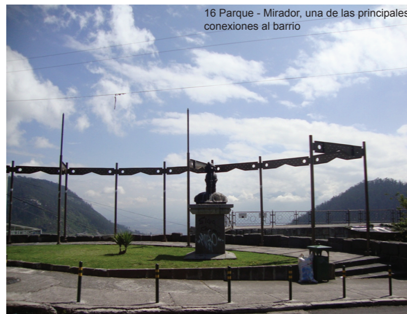
Parque de Guápulo, vista hacia los valles de Cumbayá (este)

Guápulo forma parte del centro histórico de Quito, con más de 400 años de historia, por ende se incluye en la declaratoria de “Patrimonio Cultural de la Humanidad.” Ha sido escenario de diversas expresiones culturales y religiosas. Antes de la conquista española el sitio servía como espacio de encuentro, intercambio y culto a los dioses, para la cultura indígenas, sobre todo para la cultura Chibcha, que aparecen como sus primeros pobladores.