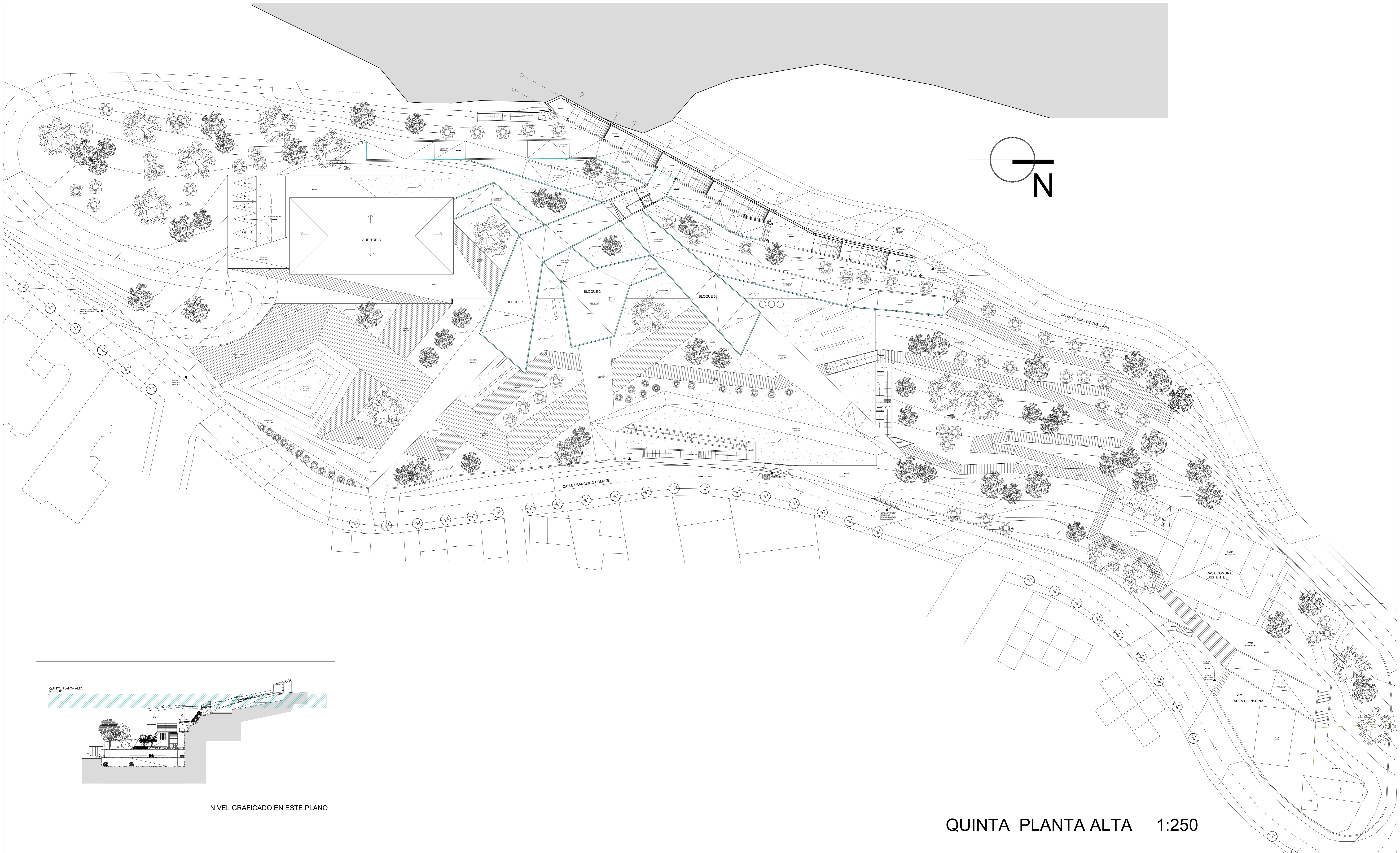
QUINTA PLANTA ALTA 1:250