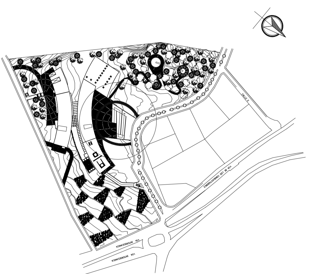
PLANTA GENERAL SIN ESCALA