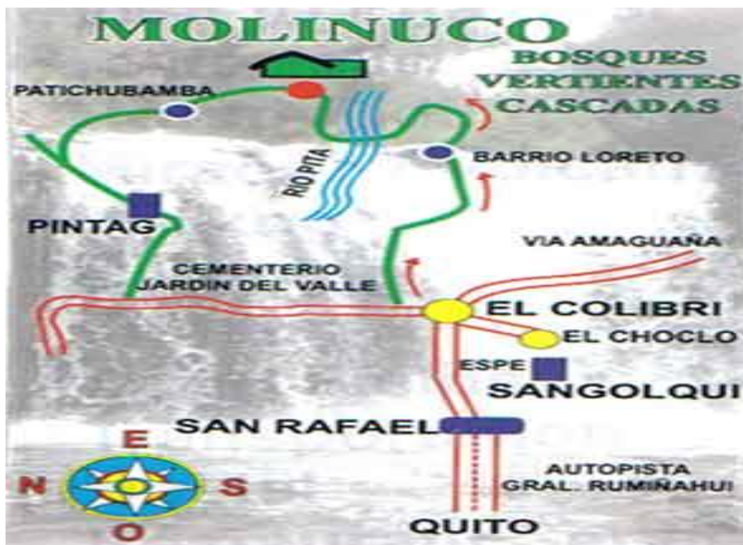
MAPA 1. MOLINUCO