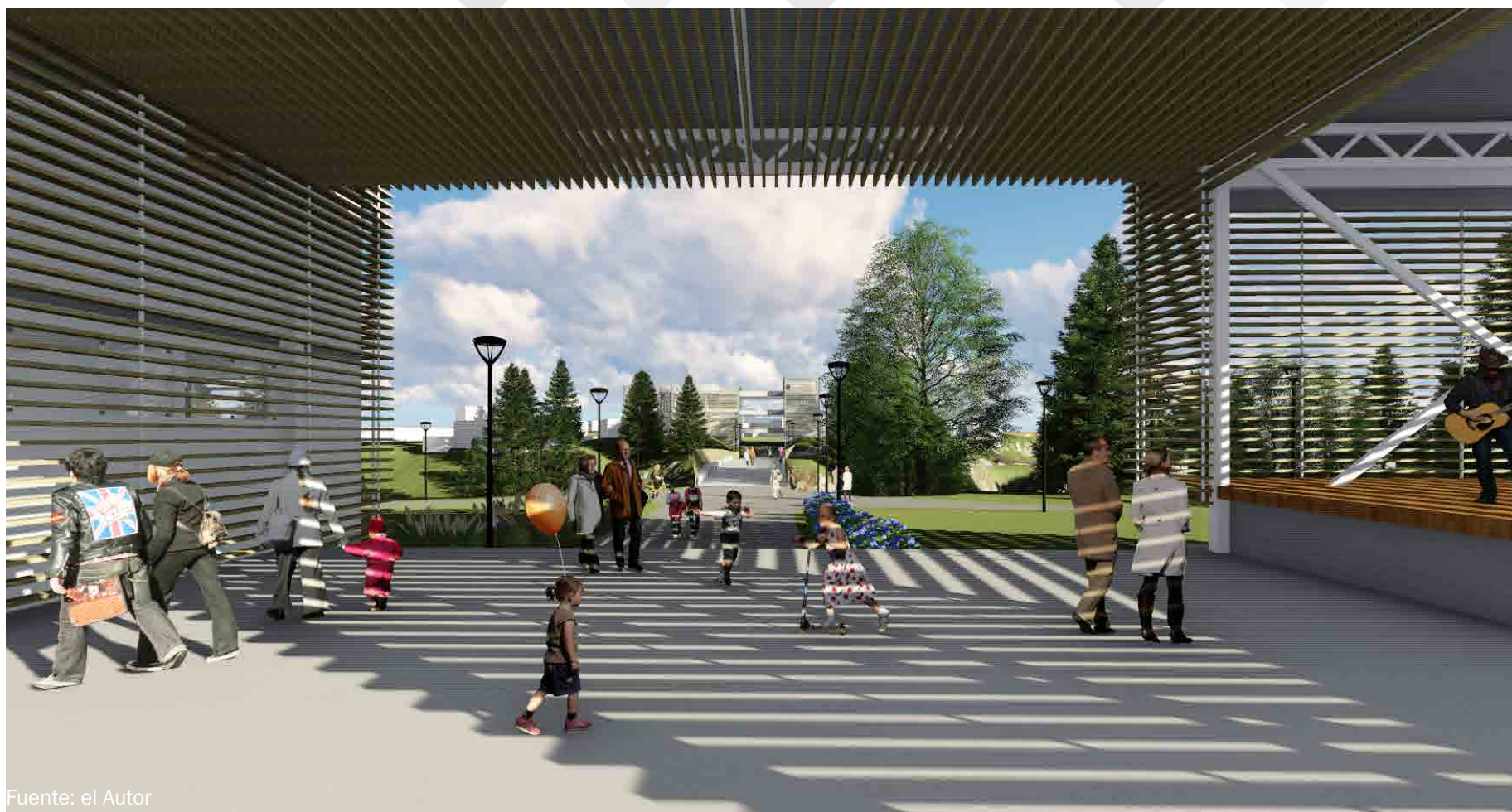
VISTA EXTERIOR EDIFICIO B