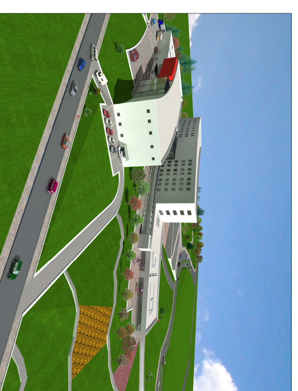
2. VISTA GENERAL DE LOS BLOQUES